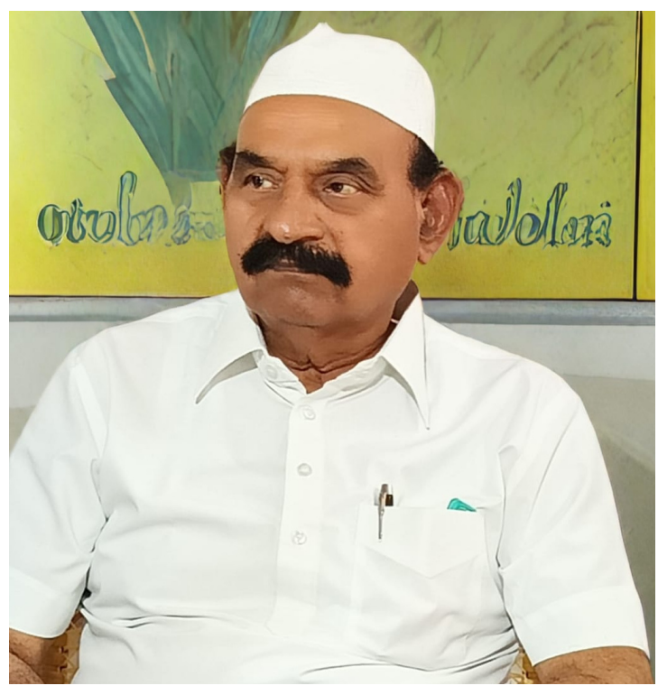
రాష్ట్రస్థాయి ఇష్టార్ కు రూ. 75 లక్షలు విజయవాడ ఏ- కన్వెన్షన్ సెంటర్ లో ముఖ్యమంత్రి నారా చంద్రబాబు నాయుడు అధ్యక్షతన ఏర్పాటు చేయబోయే రాష్ట్రస్థాయి ఇష్టార్

అమరావతి మార్చి 11 ఆంధ్ర ప్రదేశ్ పవిత్ర రంజాన్ మాసంలో రాష్ట్రవ్యాప్తంగా అన్ని జిల్లాల స్థాయిలో ఇష్టార్ ఏర్పాటు చేయడానికి ప్రభుత్వం నిర్ణయించింది. ఇందుకోసం రూ. 1.50 కోట్లు నిధులను విడుదల చేసింది. ముస్లిం మైనారిటీల కు అత్యంత భక్తిశ్రద్ధలతో కూడిన రంజాన్ మాసంలో సాయంకాలం ఉపవాస దీక్ష విరమణ కార్యక్రమంలో భాగంగా ఈనెల 16వ తేదీన రాష్ట్ర స్థాయి ప్రభుత్వ ఇష్టార్ కార్యక్రమాన్ని విజయవాడలో ఏ-కన్వెన్షన్ సెంటర్లో నిర్వహించేందుకు నిర్ణయించారు. రాష్ట్రంలోని ఆయా జిల్లాల కలెక్టర్లు రానున్న 4, 5 రోజులలో జిల్లా స్థాయి ఇష్టార్ కార్యక్రమాన్ని వారికి అనువైన రోజున నిర్వహిస్తారు. ఇష్టార్ ను జిల్లాస్థాయిలో ఆయా జిల్లాల కలెక్టర్లు, మైనారిటీ సంక్షేమ శాఖ అధికారులు ప్రణాళికాబద్ధంగా, పక్కపక్కాగా, మనోరంజకంగా నిర్వహించాలని న్యాయ, మైనారిటీ సంక్షేమ శాఖ మంత్రి ఎన్ఎంఐ ఘోషించారు.