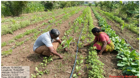
చేస్తూ, ఏటా రే3,60,000 నికర ఆదాయం పొందుతున్నారు. ఇదే కాకుండా ఆయన 25 సెంట్లలో ఏటీఎం మోడల్ను ఏర్పాటు చేసి కూరగాయలు మరియు అకుకూరలను నిరంతరం ఉత్పత్తి చేస్తున్నారు. దీనితో పాటు డ్రై ఫామ్ నిర్వహిస్తూ, ఎరువుల కోసం అవులను పోషిస్తున్నారు. భవిష్యత్తులో మరింత భూమిని కొలుకు తీసుకొని ప్రకృతి వ్యవసాయాన్ని విస్తరించాలని, పాఠశాలలు, వసతిగృహాల్లో కిచెన్ గార్డెన్లు ఏర్పాటు చేసి రసాయన రహిత ఆహారం గురించి పిల్లలకు అవగాహన కల్పించాలని ఆయన లక్ష్యంగా పెట్టుకున్నారు.

ప్రస్తుతం ఆయన ఆరు ఎకరాల భూమిలో వివిధ పంటల సమగ్ర వ్యవసాయాన్ని చేస్తున్నారు. నాలుగు ఎకరాలలో పామ్ ఆయిల్, అరటి, మొక్కజొన్న, అకుకూరలు, పెసర్లు, అలసందలు, మినములు, సువ్వులు వంటి పంటలను సాగు చేస్తూ ఏటా రే2,60,000 నికర ఆదాయం పొందుతున్నారు. అదనంగా 1.75 ఎకరాల్లో 10+10 ఎకరాల ప్రకృతి వ్యవసాయ మోడల్ అమలు చేస్తూ ప్రధాన పంటగా నిమ్మను సాగు చేస్తున్నారు. ఈ తోటలో మామిడి, జామ, సపోటా, సీతాఫలం, బొప్పాయి, నేరడు, ఆముదం, పసుపు, చెరకు, అతి పూల మొక్కలను సాగు