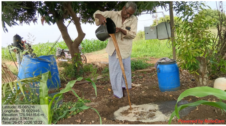
అంధ్ర ప్రగతి నంద్యాల మార్చి 12: ప్రకృతి వ్యవసాయం పట్ల ఆసక్తి పెరిగేలా చేశారు. ఇప్పుడు, ఆయన 'ఏటీఎం మోడల్' కూడా నిర్వహిస్తున్నారు. 25 సెంట్ల భూమిలో 10 రకాల కూరగాయలు, 5 రకాల అకుకూరలు, పూల మొక్కలు సాగు చేస్తూ, ప్రతి వారం రే5,500 ఆదాయం పొందుతున్నారు. ఇది నిరంతరం ఆదాయాన్ని అందిస్తుంది.