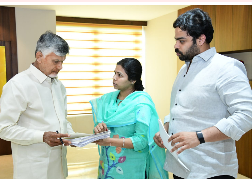
ఆంధ్ర ప్రగతి అమరావతి మార్చి 17:

మంగళవారం నాడు అమరావతిలో ముఖ్యమంత్రి నారా చంద్రబాబు నాయుడు ని మర్యాదపూర్వకంగా కలిసి, ఆక్షగడ్డ నియోజకవర్గ అభివృద్ధి మరియు ప్రజా సమస్యలపై సుదీర్ఘంగా చర్చించడం జరిగింది.ముఖ్యంగా, పంటలు చేతికి వచ్చే ఈ కీలక సమయంలో కేసీ కెనాల్ చివర ఆయకట్టు రైతులకు సాగునీటి ఇబ్బంది కలగకుండా, ఈ నెలాఖరు వరకు నీటిని విడుదల చేయాలని ముఖ్యమంత్రి గని కోరడం జరిగింది. అలాగే, రానున్న వేసవి దృష్ట్యా నియోజకవర్గంలో ఎక్కడా తాగునీటి ఎద్దడి తలెత్తకుండా ముందస్తు చర్యలు చేపట్టాలని, అందుకు అవసరమైన నిధులను తక్షణమే మంజూరు చేయాలని విన్నవించాను.నా అభ్యర్థనలపై సానుకూలంగా స్పందించి, సమస్యల పరిష్కారానికి హామీ ఇచ్చిన ముఖ్యమంత్రి కి ప్రత్యేక కృతజ్ఞతలు. ఆక్షగడ్డ ప్రజల సంక్షేమం మరియు నియోజకవర్గ సమగ్ర అభివృద్ధి కోసం మా ప్రభుత్వం నిరంతరం కట్టుబడి ఉంటుంది.