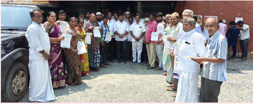
ఆంధ్ర ప్రగతి నంద్యాల మార్చి 17:

నంద్యాల నియోజకవర్గంలో మంత్రి ఫిరోజ్ తనయుడు నంద్యాల టీడీపీ జిల్లా ప్రధాన కార్యదర్శి ఎన్ఎండి ఫిరోజ్ ప్రజలకు నేనున్నానంటూ భరోసా కల్పిస్తున్నారు. ప్రజలు ఆపద సమయాల్లో అందించే మెడికల్ రీయబర్సింగ్ ముఖ్యమంత్రి సహాయ నిధి లబ్ధిదారులకు ఈరోజు నంద్యాల తెలుగుదేశం పార్టీ కార్యాలయం లో గత 4 రోజుల కిందట మంత్రి ఫిరోజ్ గారు ఇచ్చిన తర్వాత మిగిలిన 24 చెక్కులను బాధ్యత కుటుంబ సభ్యులకు అందజేయడం జరిగింది.