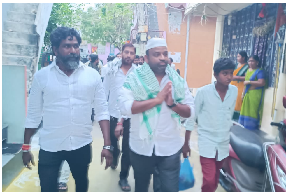
ఆంధ్ర ప్రగతి నంద్యాల మార్చి 17:

-అయిదేళ్లుగా కులమతాలకు అతీతంగా ఇఫ్తార్ విండు.