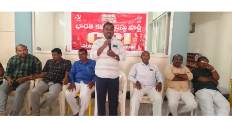
ఆర్కాటంగా ప్రకటించి, అధికారంలోకి వచ్చి రెండేళ్లు కావచ్చున్నా ఆ ఊస్ ఎత్తకపోవడం దారుణమన్నారు. గతంలో సిపిఐ ఆధ్వర్యంలో పట్టణ ప్రాంతంలో ఇళ్లు లేని లబ్ధిదారులతో 3 వేల మందికి పైగా స్వీయ అర్జీలు ఇప్పించడం జరిగిందని, అప్పట్లో అర్జులైన వారిని గుర్తిస్తామని చెప్పి ఇప్పుడు కాలయాపన చేస్తున్నారని మండిపడ్డారు. పట్టణ ప్రాంతాల్లో అద్దె ఇళ్లలో నివసిస్తున్న పేదల పరిస్థితి అత్యంత దయనీయంగా మారినదని, అందుకే గతంలో అర్జీలు ఇచ్చిన లబ్ధిదారులందరినీ కలుపుకొని ఈ నెల 24న రాష్ట్ర సమితి పిలుపు మేరకు నిర్వహించే ధర్నా కార్యక్రమాన్ని జయప్రదం చేయాలని పిలుపునిచ్చారు. ఒకవేళ 24వ తేదీ ధర్నా తర్వాత కూడా కూటమి ప్రభుత్వం ఇళ్ల స్థలాలు ఇవ్వకుంటే, నంద్యాల