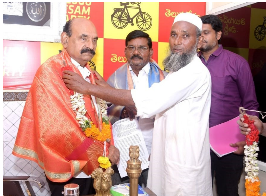
ఆంధ్ర ప్రగతి నంద్యాల, మార్చి 18:

రంజాన్ పర్వదినాన్ని పురస్కరించుకుని నంద్యాల జిల్లాలోని మౌజుద్ద మరీయు ఇమామ్లకు ఆరు నెలల గౌరవ వేతనాన్ని రాష్ట్ర ప్రభుత్వం విడుదల చేసింది. ఇమామ్లకు నెలకు రూ. 10,000, మౌజుద్దకు నెలకు రూ. 5,000 చొప్పున 2025 అక్టోబరు నుండి 2026 మార్చి వరకు ఉన్న బకాయి మొత్తాన్ని ఒకేసారి విడుదల చేయడంపై నంద్యాల జిల్లా పులిమిద్రి గ్రామం మసీదు ముత్తవల్లి షేక్ హుస్సేన్ హార్డు వ్యక్తం చేశారు. ఈ సందర్భంగా మైనారిటీల సంక్షేమం పట్ల ప్రత్యేక శ్రద్ధ వహిస్తున్న ముఖ్యమంత్రి నారా చంద్రబాబు నాయుడు కి మరియు మైనార్టీ సంక్షేమ శాఖ మంత్రి శ్రీ ఎన్.ఎమ్.డి. భరూక్ కి పులిమిద్రి గ్రామ ముత్తవల్లి షేక్ హుస్సేన్ మరియు పులిమిద్రి గ్రామ ప్రజలు ప్రత్యేక కృతజ్ఞతలు తెలియజేశారు.