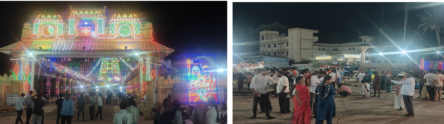
ఆంధ్ర ప్రగతి మహానంది మార్చి 20:

..50 రూ టికెట్ కొంటేనే దర్శనం. --ఎంతో వ్యయ ప్రయాసలపై వచ్చిన భక్తులకు నిరాశేనా?!