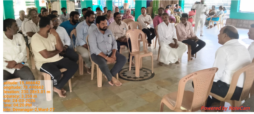
అంధ ప్రగతి నంద్యాల మార్చి 24: