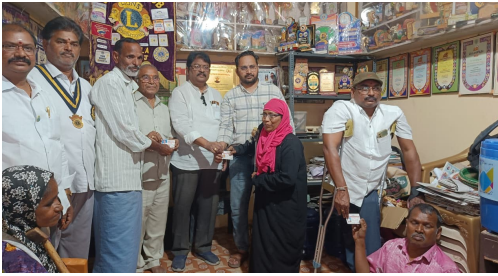
అంధ ప్రగతి నంద్యాల మార్చి 24: