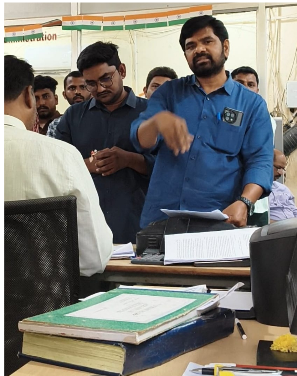
ఆంధ్ర ప్రతి నంద్యాల జిల్లా మార్చి 25:

ప్రభుత్వ భూములా, లిటిగేషన్ భూములా అన్న తేడా లేకుండా డబ్బులు ఇస్తే రిజిస్ట్రేషన్ చేసేందుకు సిద్ధమవుతున్నారన్న ఆరోపణలు వెల్లువెత్తుతున్నాయి. ఇది భూ వ్యవస్థపై ప్రజల విశ్వాసాన్ని దెబ్బతీస్తోందని నిపుణులు అభిప్రాయపడుతున్నారు.