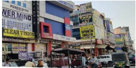
నుంచి వచ్చే ఫిర్యాదులను పరిష్కరించడం వంటి బాధ్యతలు చూస్తుంది. అంతేకాక మీడియా కథనాలు లేదా పోలీసు రిపోర్టుల ఆధారంగా సుమోలోగా తనిఖీలు చేసే అధికారాన్ని కూడా ఈ కమిటీకి కల్పించారు. కొత్త నిబంధనల ప్రకారం కోచింగ్ సెంటర్లు రోజుకు గరిష్ఠంగా ఐదు గంటలు మాత్రమే పనిచేయాలి. పాఠశాలలు, కళాశాలలు నడిచే సమయంలో కోచింగ్ తరగతులు నిర్వహించకూడదు. ఆదివారం తప్పనిసరిగా సెలవు ప్రకటించాలి. విద్యార్థుల మానసిక ఆరోగ్యం కోసం ప్రతి కేంద్రంలో ఒక వేల్ఫేర్ సెంటర్ను ఏర్పాటు చేసి, కౌన్సిలింగ్ అందించాలి. ఆత్మహత్యలను నివారించేందుకు స్ప్రింగ్ లోడెడ్ ఫ్యాషన్లు ఏర్పాటు చేయాలని నిబంధనల్లో స్పష్టంగా పేర్కొన్నారు.

ఏపీలో పుట్టగొడుగుల్లా వెలుస్తున్న ప్రైవేట్ కోచింగ్ సెంటర్ల నియంత్రణపై రాష్ట్ర ప్రభుత్వం దృష్టి సారించింది. విద్యార్థులపై పెరుగుతున్న ఒత్తిడి, ఆత్మహత్యల నివారణే లక్ష్యంగా కీలక నిర్ణయాలు తీసుకుంది. ఇకపై రాష్ట్రంలో కోచింగ్ సెంటర్ నిర్వహించాలంటే రిజిస్ట్రేషన్ తప్పనిసరి చేస్తూ 'ఏపీ కోచింగ్ సెంటర్ల నియంత్రణ, పర్యవేక్షణ నిబంధనలు-2026' పేరుతో కొత్త నోటిఫికేషన్లను విడుదల చేసింది. ఇప్పటికే నడుస్తున్న కేంద్రాల కూడా మూడు నెలల్లోగా తప్పనిసరిగా రిజిస్ట్రేషన్ చేసుకోవాలని స్పష్టం చేసింది. ఇటీవలి కాలంలో విద్యార్థులపై ఒత్తిడి పెరిగి ఆత్మహత్యలకు పాల్పడుతున్న ఘటనల నేపథ్యంలో ప్రభుత్వం ఈ చర్యలు చేపట్టింది. కొత్త నిబంధనల పర్యవేక్షణ కోసం జిల్లా స్థాయిలో కలెక్టర్ అధ్యక్షతన ఒక కమిటీని ఏర్పాటు చేయనుంది. ఈ కమిటీలో కోచింగ్ సెంటర్లకు రిజిస్ట్రేషన్లు మంజూరు చేయడం, విద్యార్థుల