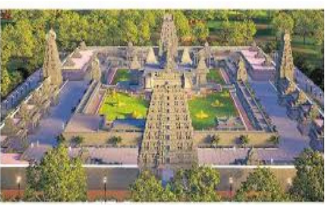
కాలం నాటి మవలీశ్వర ఆలయం, 800 ఏళ్ల నాటి కాకతీయుల వీరభద్రస్వామి ఆలయం ఉన్నాయి. చేప ఆకారంలో శివలింగం ఉండటంతో ఈ ఆలయానికి మవలీశ్వరుడు అనే పేరు వచ్చింది. ఇప్పుడు నిర్మించబోయే ఆధునాతన ఓంకారేశ్వర ఆలయంతో ఈ ప్రాంతం ప్రాచీన, ఆధునాతన సంగమంగా మారి 'చిన్న త్రీశైలం'గా ప్రసిద్ధి చెందుతుందని ప్రభుత్వం, భక్తులు ఆశాభావం వ్యక్తం చేస్తున్నారు.

నిలవనుంది. రామప్ప, యాదగిరిగుట్ట నిర్మాణాల్లో వాడిన నాణ్యమైన కృష్ణశిలతోనే ఈ ఆలయాన్ని కూడా నిర్మించనుండటం విశేషం. ఈ ప్రాజెక్టులో భాగంగా మూసీ నది మధ్యలో 100 అడుగుల భారీ శివుడి విగ్రహాన్ని ఏర్పాటు చేయనున్నారు. సదీపు చెక్డ్యామ్ నిర్మించి బోటింగ్ వంటి పర్యాటక సౌకర్యాలను కల్పించనున్నారు. ఆలయానికి వచ్చే భక్తుల సౌకర్యాలకు సరిపడా పార్కింగ్ వసతి, ఔటర్ రింగ్ రోడ్డు నుంచి నేరుగా కనెక్టివ్ కల్పిస్తారు. సమీపంలోని శతాబ్దాల చరిత్ర కలిగిన వీరభద్రస్వామి ఆలయం ఉన్న గుట్టపైకి వెళ్లేందుకు అత్యాధునిక తీగల వంతెనను నిర్మించనున్నారు. ఈ ప్రాంతంలో ఇప్పటికే 1400 ఏళ్ల నాటి చాళుక్యుల