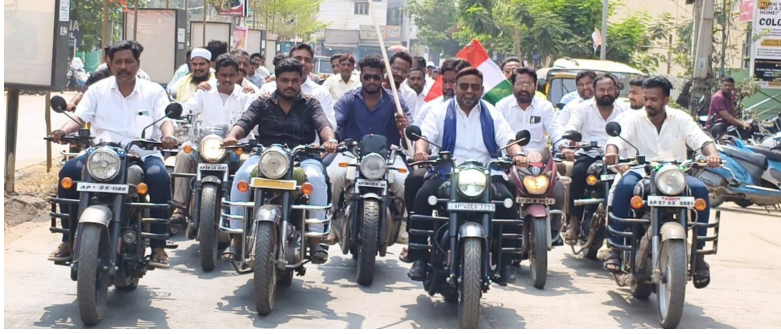
ఆంధ్ర ప్రగతి నంద్యాల, ఏప్రిల్ 14: