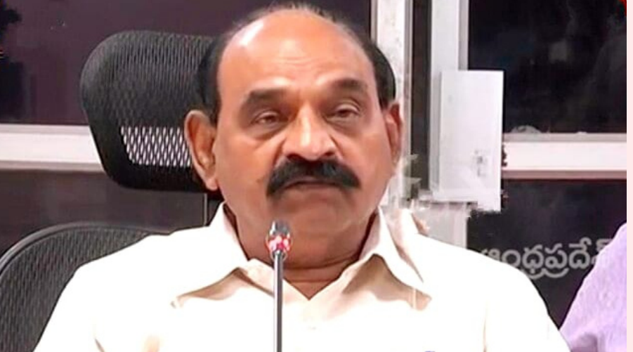
అంధ్ర ప్రదేశ్ నంద్యాల జిల్లా ఏప్రిల్ 15:

..నంద్యాలను అభివృద్ధి పదంలో నడిపిస్తున్న మంత్రి ఫరూక్.