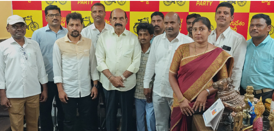
అంధ్ర ప్రదేశ్ నంద్యాల ఏప్రిల్ 15: