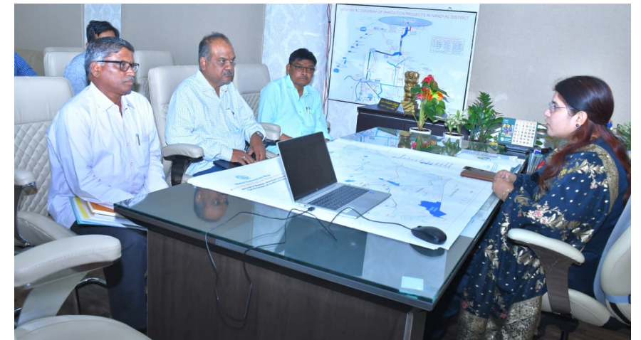
అంధ్ర ప్రదేశ్ నంద్యాల, ఏప్రిల్ 15: