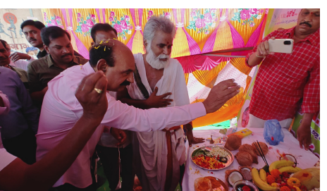
అంధ్ర ప్రదేశ్ నంద్యాల ఏప్రిల్ 15:

నంద్యాల పట్టణ పరిధిలోని 32 వ వార్డు (టోమ్ముల సత్రం)లో భారీ ఎత్తున చేపట్టిన అభివృద్ధి పనులకు రాష్ట్ర న్యాయశాఖ మరియు మైనారిటీ సంక్షేమ శాఖ మంత్రి ఎన్ఎండి ఫరూక్ ముఖ్యఅతిథిగా హాజరై భూమి పూజ చేశారు. ఈ సందర్భంగా మంత్రి ఎన్ఎండి ఫరూక్ మాట్లాడుతూ ప్రజలకు ఇచ్చిన మాట ప్రకారం నంద్యాల పట్టణాన్ని అన్ని రంగాల్లో అభివృద్ధి తీర్చిదిద్దడమే మా లక్ష్యమని తెలిపారు. 32 వ వార్డులో గత కొంతకాలంగా ఉన్న రోడ్డు, డ్రైనేజీ సమస్యలను దృష్టిలో ఉంచుకుని, రా. 2.5 కోట్లతో పటిష్టమైన