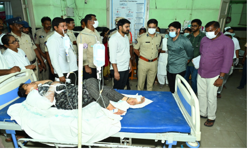
మోడీ దీక్షా- మృతుల కుటుంబాలకు, గాయపడిన వారికి పరిహారం ప్రకటన