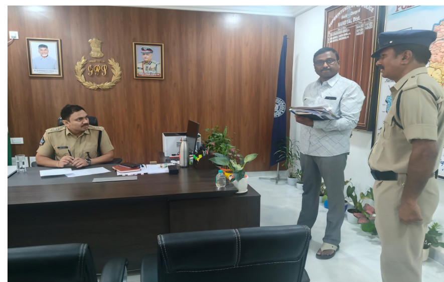
ఆంధ్ర ప్రగతి నంద్యాల జిల్లా క్రైమ్ ఏప్రిల్ 17: