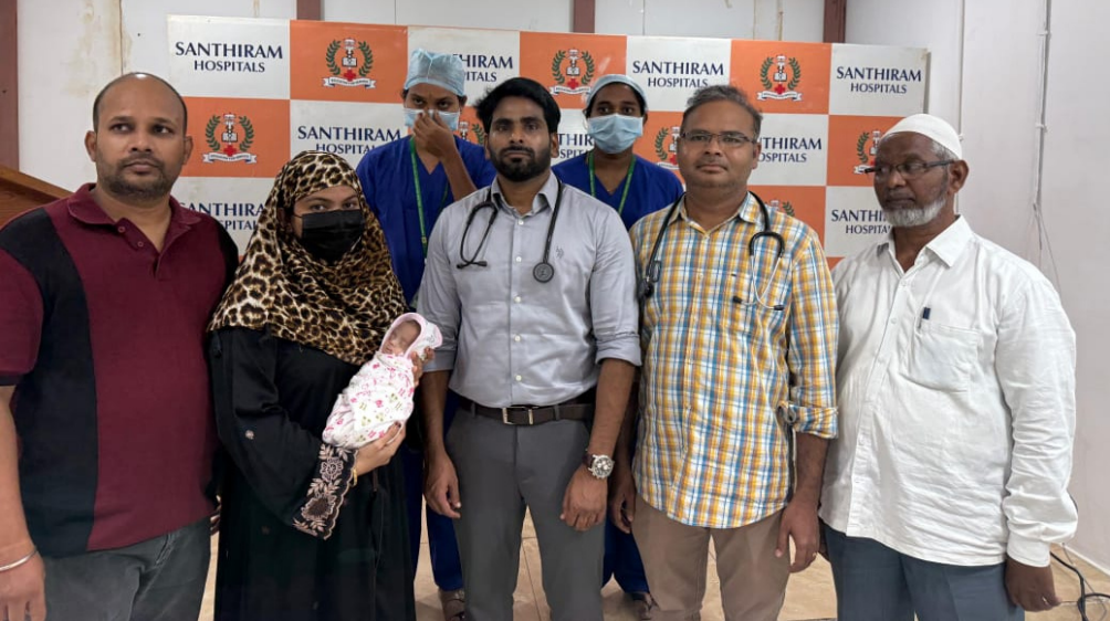
చిన్నారి పాపకు మెరుగైన వైద్యం అందించి ఆరోగ్యంగా తల్లిదండ్రుల చేతులకు అప్పజెప్పిన శాంతి రామ్ హాస్పిటల్ డాక్టర్లు

..చిన్నారి ప్రాణం నిలిపిన డాక్టర్ లు ఆరోగ్య శ్రీ.