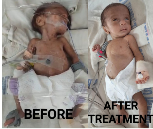
రెండు నెలలు శ్రమించి చిన్నారి ప్రాణం కాపాడిన శాంతి రామ్ హాస్పిటల్ డాక్టర్లు

ఇలాంటి కేసులకు కార్పొరేట్ హాస్పిటల్స్లో సాధారణంగా ₹10 నుండి 60 లక్షల వరకు ఖర్చు అవుతుండగా, శాంతిరామ్ హాస్పిటల్లో మాత్రం ఉచితంగా ఉత్తమ చికిత్స అందించారు. డెడికేటెడ్ ఎన్ ఐ సి యు టీమ్ , అనుభవజ్ఞులైన వీడియాట్రీక్ డాక్టర్లు , 24/7 పర్యవేక్షణ తో ఒక్క బేబీకి ఒక నర్స్ (One on One care) 11 మంది నిపుణుల టీమ్ తో పూర్తి స్థాయి పురిటి మరియు చిన్నపిల్ల వైద్య సేవలు అందిస్తున్నారు. పిల్లల ఆరోగ్యానికి ఉత్తమ సేవలు అందించడానికి శాంతిరామ్ హాస్పిటల్ ఎప్పుడూ సిద్ధంగా ఉందని ముఖ్యంగా పెదవారికి అండగా ఉంటుందని తెలిపిన శాంతి రామ్ హాస్పిటల్ యాజమాన్యం.