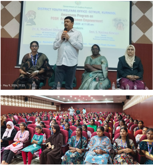
విశాఖ జడ్జిమెంట్ (1997) నుంచి ప్రారంభమైన ఈ పోరాటంలో ట్రివెన్స్ ఆఫ్ సెక్యూలర్ హరాస్ట్మెంట్ లో వర్క్ షేప్ చట్టం మైలురాయిగా నిలిచిందని తెలిపారు.