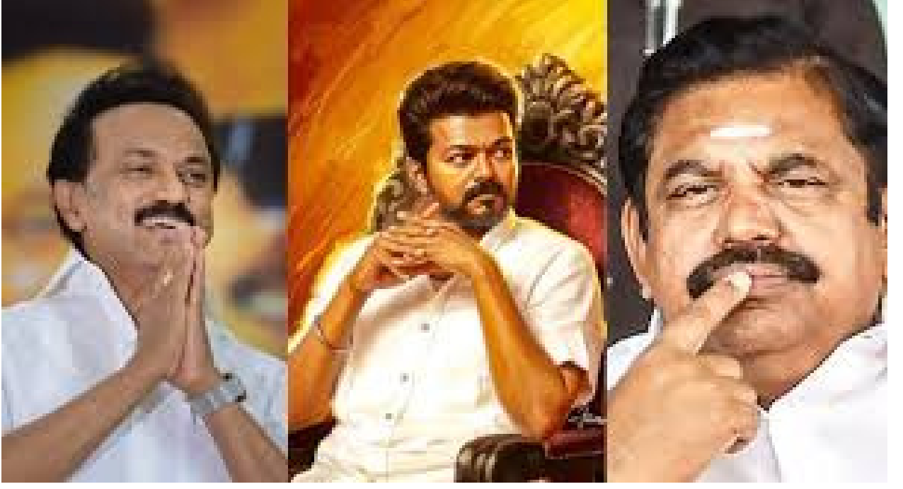
తనని ఇబ్బంది పెట్టకండి అని నేను మీ అందరితో నా మనసులో ఉన్న అభిప్రాయాన్ని ప్రేమతో తెలియజేస్తున్నాను.