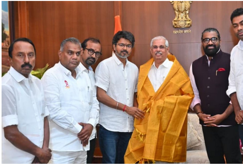
నిలబెట్టేందుకు కూడా డిఎంకే ఒప్పుకుంది.