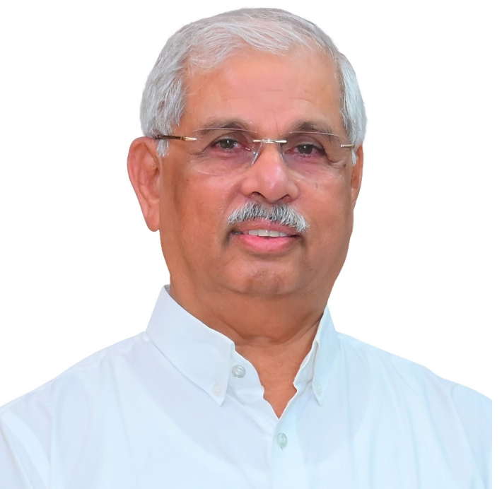
లేకపోవడంతో పప్పులో కాలేసాడట