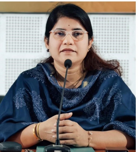
సూచనలు ప్రదర్శించాలని తెలిపారు.

వడగాల్పులపై ప్రజల్లో అవగాహన పెంచేందుకు వార్డు సచివాలయాలు, గ్రామ సచివాలయాలు, స్టాఫ్ మీడియా, వాట్సాప్ గ్రూపులు, స్థానిక కేబుల్ నెట్వర్కులు, ప్రజా ప్రకటన వ్యవస్థలను వినియోగించాలని ఆదేశించారు. ఎలక్ట్రానిక్ డిస్ప్లే బోర్డుల ద్వారా ఉష్ణోగ్రత హెచ్చరికలు, జాగ్రత్తల