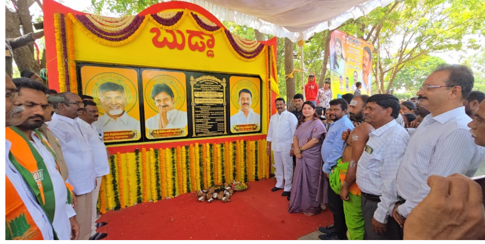
తెలిపారు. వివిధ ప్రాంతాల నుంచి వచ్చి ఇక్కడ స్థిరపడిన ప్రజలు కూడా ఈ ప్రాంత అభివృద్ధిలో భాగస్వాములయ్యారని పేర్కొన్నారు.