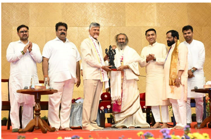
ఆర్ట్ ఆఫ్ లివింగ్ వంటి సంస్థలు ఏపీలో పనిచేయాలి: చంద్రబాబునాయుడు ఫౌండేషన్ 45 వ వార్షికోత్సవ కార్యక్రమంలో పాల్గొన్న సీఎం హింసలేని సమాజం, ఒత్తిడి లేని మనుషులు అనే అంశాన్ని బోధిస్తున్నారన్న సీఎం గ్రామాల నుంచి కొలంబియా వరకు అనిశ్చితి నెలకొంటే చర్చల ద్వారా మార్పులు