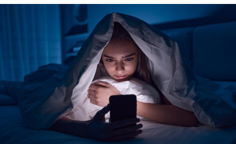
వీడియోలు, సంభాషణలు క్షణాల్లో రికార్డ్ అవుతాయి. బ్లాక్ మెయిల్ దండా: "మీ భర్తకు చూపిస్తాం, బంధువులకు పంపుతాం" అంటూ లక్షలాది రూపాయలు డిమాండ్ చేసే ముఠాలు నగరంలో పొంచి ఉన్నాయి.

ఆధునిక సాంకేతికత అందిచ్చుకున్న స్మార్ట్ ఫోన్ చేతిలో ఉంటే చాలు.. ప్రపంచాన్నే చుట్టేయొచ్చు. కానీ, అదే ఫోన్ కొన్నిసార్లు నిండు సంసారాల్లో చిచ్చు పెడుతోంది. కష్టాల్లో ఉన్నప్పుడు కుటుంబానికి అండగా నిలవాల్సిన విచక్షణను హరించి వేస్తోంది. నగరంలో ఇటీవల వెలుగుచూస్తున్న కొన్ని క్రైమ్ సంఘటనలు, కొన్నిటింగ్ సంబంధక వస్తున్న కేసులు చూస్తుంటే సమాజం ఎటు వైపు వెళ్తోందనే ఆందోళన కలగక మానదు.