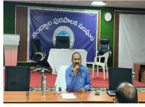
కార్యక్రమాన్ని అమలు చేయనున్నట్లు ఆయన వెల్లడించారు. దీనిలో భాగంగా రేపు ఉదయం 6.00 గంటలకు గాంధీ చౌక్ కూరగాయల మార్కెట్ వద్ద »»Red/Yellow Spots, Roads È Visible Cleanliness