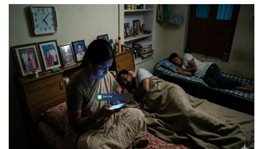
బంధులకు కట్టుబడి ఉండడమే నిజమైన సంస్కారం. భర్త పోతే ఉంటూ, ఆయన తిండి తింటూ, ఆయన నిద్రపోయాక వెనకనుంచి ఇలాంటి ద్రోహానికి ఒడిగట్టడం క్రొవ్వికలేక మచ్చ.

బాధ్యత మరిచిన అర్ధరాత్రి చాటింగ్ లు రాత్రి ఒంటిగంట దాటింది.. ఇంట్లో భర్త తీవ్ర అనారోగ్యంతో మంచానపడ్డారు. పక్కనే పిల్లలు రేపటి భవిష్యత్తుపై సమ్మతంతో నిద్రపోతున్నారు. ఆ సమయంలో వారికి డ్రైర్లం చెప్పి, అండగా ఉండాలని 45 ఏళ్ల ఇల్లాలు.. ఫోన్ పట్టుకుని అపరిచితులతో 'బోల్డ్', 'అడల్ట్' చాటింగ్ లలో మునిగిపోవడం ఏ రకమైన సంస్కృతి? 45 ఏళ్లు అంటే జీవితంపై పూర్తి అవగాహన రావాల్సిన వయసు. డీనేజీలో ఉన్న పిల్లలకు తల్లి ప్రవర్తన రోల్ మోడల్. అలాంటిది అర్ధరాత్రి ఫూట పరాయి వ్యక్తులతో శృంగార సంభాషణలు చేయడం కుటుంబానికే కాదు, ఆమె పుక్కితాన్నికీ తీవ్ర నష్టం చేకూరుస్తోంది. ఇది ఎట్టి పరిస్థితుల్లోనూ సమర్థించదగిన విషయం కాదు.