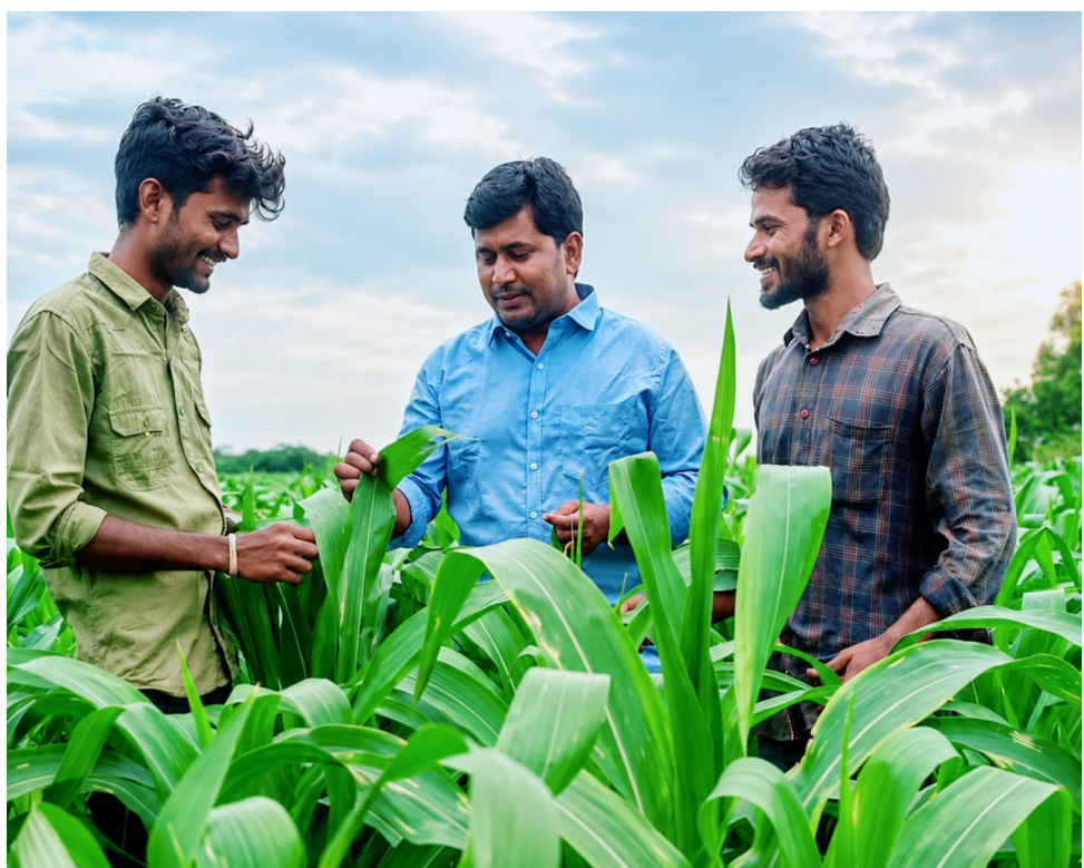
ప్రత్యేక దృష్టి సారిస్తోంది.

..సాగు ఖర్చులు తగ్గించి...దిగుబడులు పెంచి రైతును లాభాల బాట పట్టిస్తున్న అన్నదాత అసలైన మిత్రుడు.