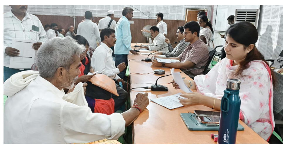
స్పష్టం చేశారు. నిర్దేశిత కాలపరిమితిలోనే సమస్యలను తప్పనిసరిగా పరిష్కరించాలి అంటూ ఆదేశించారు.

రెవెన్యూ శాఖపై ప్రత్యేక దృష్టి ఇతర శాఖలతో పోలిస్తే రెవెన్యూ సంబంధిత సమస్యలు అధికంగా ఉన్నాయని కలెక్టర్ పేర్కొన్నారు. రెవెన్యూ శాఖ పరిధిలో 387, సర్వే శాఖ పరిధిలో 150 ఫిర్యాదులు పెండింగ్లో ఉన్నాయని తెలిపారు. వీటికి సంబంధించిన ఎండార్స్ మెంట్ లను రెండు రోజుల్లో పూర్తిచేయాలని కలెక్టర్ ఆదేశించారు. ఆళ్లగడ్డలో అందిస్తున్న ఎండార్స్ మెంట్ ల వివరాలను గూగుల్ డ్రైవ్ లో ఉంచుతూ, ఎంతమందికి సేవలు అందించామనే అంశంపై స్పష్టత ఇవ్వాలని జిల్లా అధికారులను ఆదేశించారు. పీజీఆర్ఎస్ ద్వారా అందిన ఫిర్యాదుల పరిష్కారంలో హెచ్ ఓలను స్వయంగా పర్యవేక్షణ చేపట్టాలని సూచించారు. రీడింగ్ అయిన కేసులపై ప్రత్యేక దృష్టి సారించి పరిష్కార చర్యలు వేగవంతం చేయాలని ఆదేశించారు. ఫిర్యాదుల పరిష్కారానికి గడువు పొడిగించే వెసులుబాటును పూర్తిగా తొలగించినట్లు