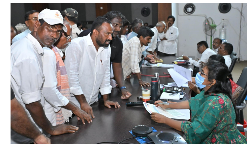
జాప్యం ఉండకూడని పేర్కొన్నారు. పిటిషనర్లకు అందించే ఎండార్స్ మెంట్ లు స్పష్టంగా, సులభంగా అర్థమయ్యే విధంగా ఉండాలని సూచించారు. సమస్యలు వెంటనే పరిష్కరించడం సాధ్యం కాని పరిస్థితుల్లో, అందుకు గల కారణాలను పూర్తిగా జిల్లా కలెక్టర్ ప్రజల నుండి వివిధ స్వీకరించి, వాటి పరిష్కారంపై అధికారులకు పలు సూచనలు చేశారు.

ఈ సందర్భంగా జిల్లా కలెక్టర్ మాట్లాడుతూ... ప్రజా సమస్యల పరిష్కారం ప్రభుత్వ యంత్రాంగం యొక్క ప్రధాన బాధ్యత. పీజీఆర్ఎస్ ద్వారా అందుతున్న ప్రతి అర్జీని అధికారులు అత్యంత ప్రాధాన్యతతో పరిశీలించి, నిర్ణయ గడువులోగా సమర్థవంతంగా పరిష్కరించాలన్నారు. సమస్య పరిష్కారంలో