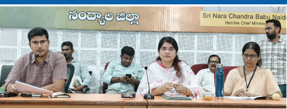
తీసుకోవాలని ఆదేశించారు. ఆ మాస్టర్ ట్రైనర్ల ద్వారా సచివాలయ సిబ్బందికి శిక్షణ ఇవ్వగా, వారు ప్రజలకు యోగా శిక్షణ అందిస్తున్నారని చెప్పారు. ఈ ఏడాది కూడా మరింత విస్తృత స్థాయిలో ట్రైనర్లను గుర్తించి శిక్షణ ఇవ్వడంతో పాటు, ప్రజలను పెద్ద ఎత్తున యోగాంధ్ర కార్యక్రమాల్లో భాగస్వామ్యం చేయాలని సూచించారు.