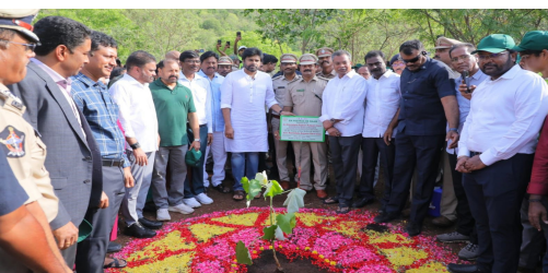
2.5 కోట్ల 'వితన బంతుల' భారీ ఉద్యమం! రాష్ట్రంలో అదవుల శాతాన్ని, పచ్చదనాన్ని భారీగా పెంచే లక్ష్యంతో పవన్ అత్యంత ప్రతిష్టాత్మకమైన 'పన మహోత్సవం' కార్యక్రమాన్ని అధికారికంగా ప్రారంభించారు. ఇందులో భాగంగా ప్రభుత్వం ఒక

మొదటిపేజీ తరువాయి అక్షయ ఎంతో అరుదైన, సాంస్కృతిక ప్రాధాన్యత కలిగిన 'తెల్ల పానీకి' మొక్కను నాటారు. ప్రపంచప్రసిద్ధి చెందిన కొండపల్లి బొమ్మల తయారీకి ఈ తెల్ల పానీకి కర్రనే ఉపయోగిస్తారు. ఈ అరుదైన మొక్కను పవన్ కల్యాణ్ తన తల్లి అంజనా దేవికి అంకితం ఇస్తూ నాటడం విశేషం.